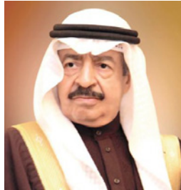
سمو رئيس الوزراء

خلال منح الجوائز الوطنية والإقليمية والدولية، منوهاً إلى أن العالم شهد في الأشهر الستة الماضية قدراً هائلاً من الوعي والتقدير لجهود الأطقم الطبية والعاملين في المجال الصحي، بما في ذلك الأطباء وجميع المهنيين المعنيين، في مواجهة جائحة فيروس كورونا (كوفيد 19).