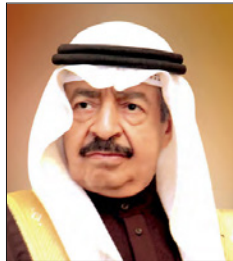
سمو رئيس الوزراء

وبدوره، عبر رئيس مجلس الأوقاف الجعفرية يوسف بن صالح الصالح عن خالص تهنئته وتبريكاته لصاحب السمو الملكي رئيس الوزراء بمناسبة نجاح الفحوصات الطبية التي تكلت بالنجاح. سائلاً الله المولى القدير والعاقي، وأن يديمه بموفقو الصحة والبناء والتقدم في ظل العهد الزاهر لحضرة عامل البلاد المجدى. كما أعرب السفير صلاح على المالكي سفير مملكة البحرين لدى دولة الكويت عن باعج سعادته وفرحته بمناسبة نجاح الفحوصات الطبية الاعتيادية التي أجريت لصاحب السمو الملكي رئيس الوزراء، داعياً الله عز وجل أن يحفظ سموه وبنيانته ويديم بموفقو الصحة والبناء والتقدم في ظل العهد الزاهر لحضرة عامل البلاد المجدى. كما أعرب السفير صلاح على المالكي سفير مملكة البحرين لدى دولة الكويت عن باعج سعادته وفرحته بمناسبة نجاح الفحوصات الطبية الاعتيادية التي أجريت لصاحب السمو الملكي رئيس الوزراء، داعياً الله عز وجل أن يحفظ سموه وبنيانته ويديم بموفقو الصحة والبناء والتقدم في ظل العهد الزاهر لحضرة عامل البلاد المجدى. كما أعرب السفير صلاح على المالكي سفير مملكة البحرين لدى دولة الكويت عن باعج سعادته وفرحته بمناسبة نجاح الفحوصات الطبية الاعتيادية التي أجريت لصاحب السمو الملكي رئيس الوزراء، داعياً الله عز وجل أن يحفظ سموه وبنيانته ويديم بموفقو الصحة والبناء والتقدم في ظل العهد الزاهر لحضرة عامل البلاد المجدى.