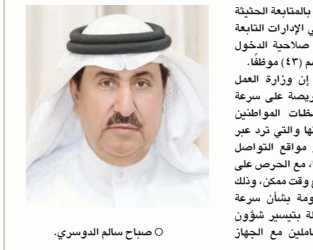
○ صباح سالم الدوسري.

حظيت خدمات وزارة العمل والتنمية الاجتماعية بنسبة رضا من قبل المستفيدين بلغت ٩٠٪ عبر نظام «تواصل»، خلال الفترة من يناير حتى نهاية يونيو ٢٠٢٠، كما تضاعف عدد المتعاملين مع النظام سواء بالاستفسارات أو الملاحظات والشكاوى أو الاقتراحات من مواطنين ومواطنات ومستشارين أو الملاحظات والشكاوى أو الاقتراحات من مواطنين ومواطنات مقارنة بالعام الماضي، بعد أن بلغوا (٢٣٦١)، مقابل (١٢١) في العام الماضي ٢٠١٩. وأكد وكيل وزارة العمل والتنمية الاجتماعية صباح صبح سالم الدوسري، أن الوزارة عملت من خلال فريق تواصل، الذي تم تشكيله بغرام من وزير العمل والتنمية الاجتماعية، على سرعة الاستجابة لطبقات الأفراد ومؤسسات وعمد تجاوزت القدرة المحددة لعدد التي تم التواصل عليها مع هيئة المعلومات والحكومة الإلكترونية، موضحاً أن الفريق يتابع كل ما يرد على النظام صفة يومية بما فيها إجراءات نهاية الأسبوع والإجازات الرسمية وعلى مدار الساعة لضمان سرعة الرد على المستفيدين بما يلي حل مشكلاتهم أو