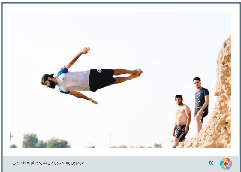
عراقيون يستنعمون في نهر دجلة ببغداد

لبيتنا نعرف كيف نسوق أنفسنا درامياً لأغتنا هذه الحكاية وهذا السيناريو عن ألف مقال وعن ألف محاضرة ورد رسمي بارد جامد لا يقرؤه أحد.