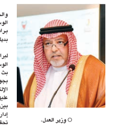
○ وزير العدل.

جاء في قرار وزير العدل أنه مع عدم الإخلال بأحكام القرار رقم (٣٦) لسنة ٢٠١٨ بشأن تحديد برامج التأهيل والتدريب للمحكوم عليهم بعقوبات بديلة وإجراءات تنفيذها، تخصص الجهة المتقدمة بتنظيم إجراءات تقديم البرامج عن بعد، وذلك برعاية التنسيق مسبقاً مع إدارة تنفيذ الأحكام بوزارة الداخلية لتحديد آلية العمل والرقابة المناسبة قبل اعتماد النظام أو التطبيق الإلكتروني في تنفيذ برامج التأهيل والتدريب عن بعد، وكذلك في مرحلة التطبيق للتحقق من التزام المحكوم عليهم بحضور البرنامج عن بعد ومدى انضباطهم، وإظهار المحكوم عليهم للضامين لبرامج التأهيل والتدريب بتواريخ ومواعيد المحاضرات عن بعد، وتزويد إدارة تنفيذ الأحكام بوزارة الداخلية بالالتزام بالبرامج المطلوبة التي تبين مدى التزام المحكوم عليهم بالتنفيذ.