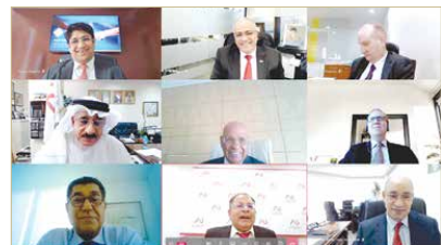
الجامعة الأهلية تعقد منتدى الجامعات ومنطلبات سوق العمل بعد الجائحة

فخرو: الجامعات أولى القطاعات بالمسارعة إلى الاستثمار في التعليم الإلكتروني