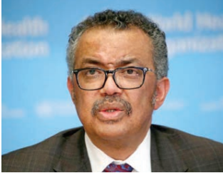
○ مدير منظمة الصحة العالمية.