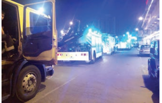
الحريق ومنعه من الانتفاخ إلى وقد تواجد في موقع الحريق عدد من سيارات شرطة النجدة وقاموا بإبعاد الأهالي من الموقع ليكلا يصاب أحد منهم...