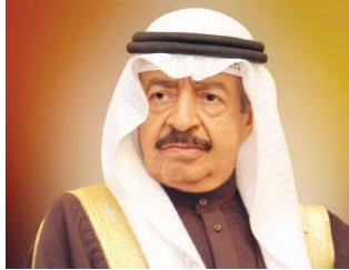
○ سمو رئيس الوزراء.

مدى انعكاس تفديري الكوادر الصحية على تحسين مستوى الأداء والحوافز الشخصية. وأشار المدير العام لمنظمة الصحة العالمية إلى أن بعض النماذج الصحية تم تطبيقها في المرافق الصحية والمستشفيات ولتلك على ذلك من خلال منح الجوائز الوطنية والإقليمية والدولية، ونوه إلى أن العالم شهد في الأشهر الستة الماضية قدراً هائلاً من الوعي والتقدير لجهود الأطقم الطبية والعاملين في المجال الصحي، بما في ذلك الأطباء وجميع المهنيين المعنيين، في مواجهة جائحة فيروس كورونا المستجد (كوفيد-19).