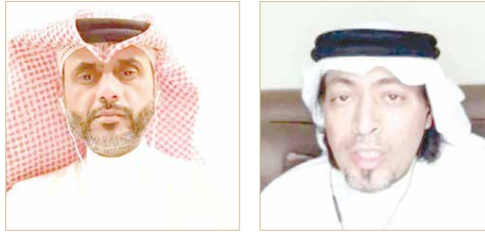
الكازم يتحدث في بث مباشر على استغرام "البلاد"

حين استقبلني سمو رئيس الوزراء أول مرة كعادة كل قائد أن يسأل عن أوجاع المرء والألامه، ولقد توقعته أن يوجه وزارة الصحة للنظر في حالنا كمرضى "سكر"، لكن سموه لم يفكر بالهلع التقليدي، بل فكر بشكل كوني، حيث كان يحفل بتغيير حال مريض "السكر" ليس في البحرين فقط، بل عالمياً.