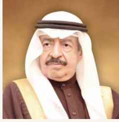
سمو رئيس الوزراء

التهنئة لصاحب السمو الملكي رئيس الوزراء على مبادرة مملكة البحرين بتحديد يوم الطبيب البحريني في أول أربعماء من شهر نوفمبر كل عام، وأكد أن هناك أدلة متزايدة على مستوى العالم حول مدى انعكاس تقدير الكوادر الصحية على تحسين مستوى الأداء والحوافز الشخصية، وأشار المدير العام لمنظمة الصحة العالمية إلى أن بعض النماذج التي تم تطبيقها في المرافق الصحية والمستشفيات دلت على ذلك من خلال منح الجوائز الوطنية والإقليمية والدولية، ونوه قديراً هائلاً من الوعي والتقدير لجهود الأطقم الطبية والعاملين في المجال الصحي، بما في ذلك الأطباء وجميع المهنيين المعتمدين، في مواجهة جائحة فيروس كورونا المستجد (كوفيد 19).