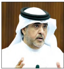
خالد بن هتات

■ لذا يجب على تلك الشركات الكشف عن أرباحها وخسائرها، وعلاقة فيروس كورونا بتلك الخسائر، حتى لا يتم تحميل أخطاء الإدارة للجائحة، وكل مؤسسة ملزمة بالكشف عن حساباتها قبل وخلال الأزمة وتوضيح كافة التفاصيل التي كانت سبباً في فصل العمال دون أدني ذنب منهم، حيث عمدت المؤسسات لاتخاذ قرار فصل جماعي لا يستند على خطأ من هؤلاء المفصولين.